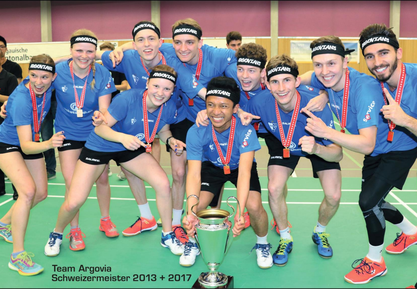
Team Argovia Schweizermeister 2013 + 2017

Alles für Meister... ...und die es werden wollen!